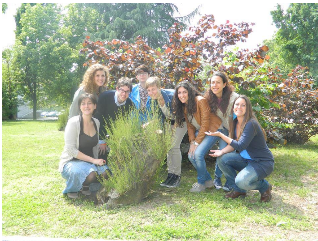
Foto di gruppo degli autori del booktrailer.